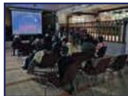
Projection d'un film pour les enfants