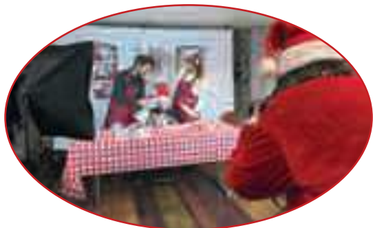
Atelier photo par Gaëlle Flament Photographie