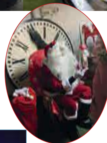
Visite du Père Noël