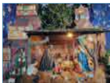
Visite de la crèche à l'église

Le dimanche 17 décembre 2023 : contes de Noël dans l'église