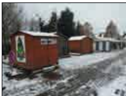
Chalets à l'arrière du foyer