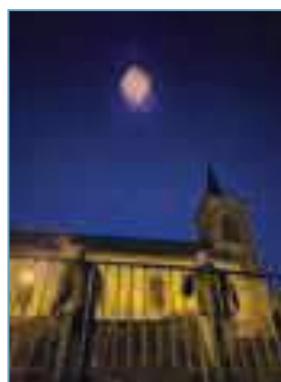
Lâcher de lanternes