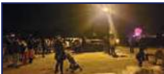
Lâcher de lanternes célestes